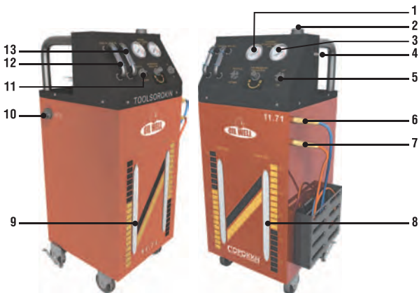
Рисунок 2 – Устройство изделия в сборе