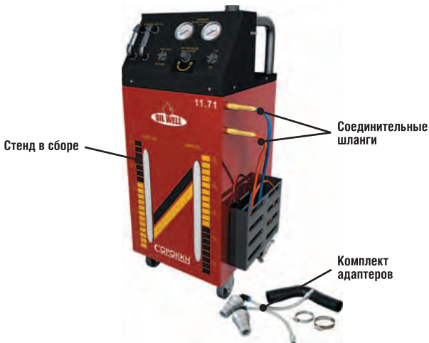
Рисунок 1 – Комплект поставки

ВНИМАНИЕ! Распаковав изделие, убедитесь в наличии всех деталей, согласно комплекту поставки. При отсутствии или поломке какой-либо детали немедленно свяжитесь с продавцом.