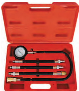
Рисунок 3. 21.33 Комплект поставки