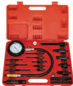
Рисунок 4. 21.39 Комплект поставки