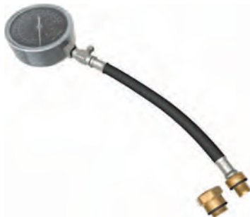
Рисунок 5. 21.40 Комплект поставки