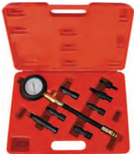
Рисунок 2. 21.32 Комплект поставки