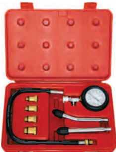
Рисунок 1. 21.29 Комплект поставки

ВНИМАНИЕ! Распаковав изделие, убедитесь в наличии всех деталей, согласно комплекту поставки. При отсутствии или поломке какой-либо детали немедленно свяжитесь с продавцом.